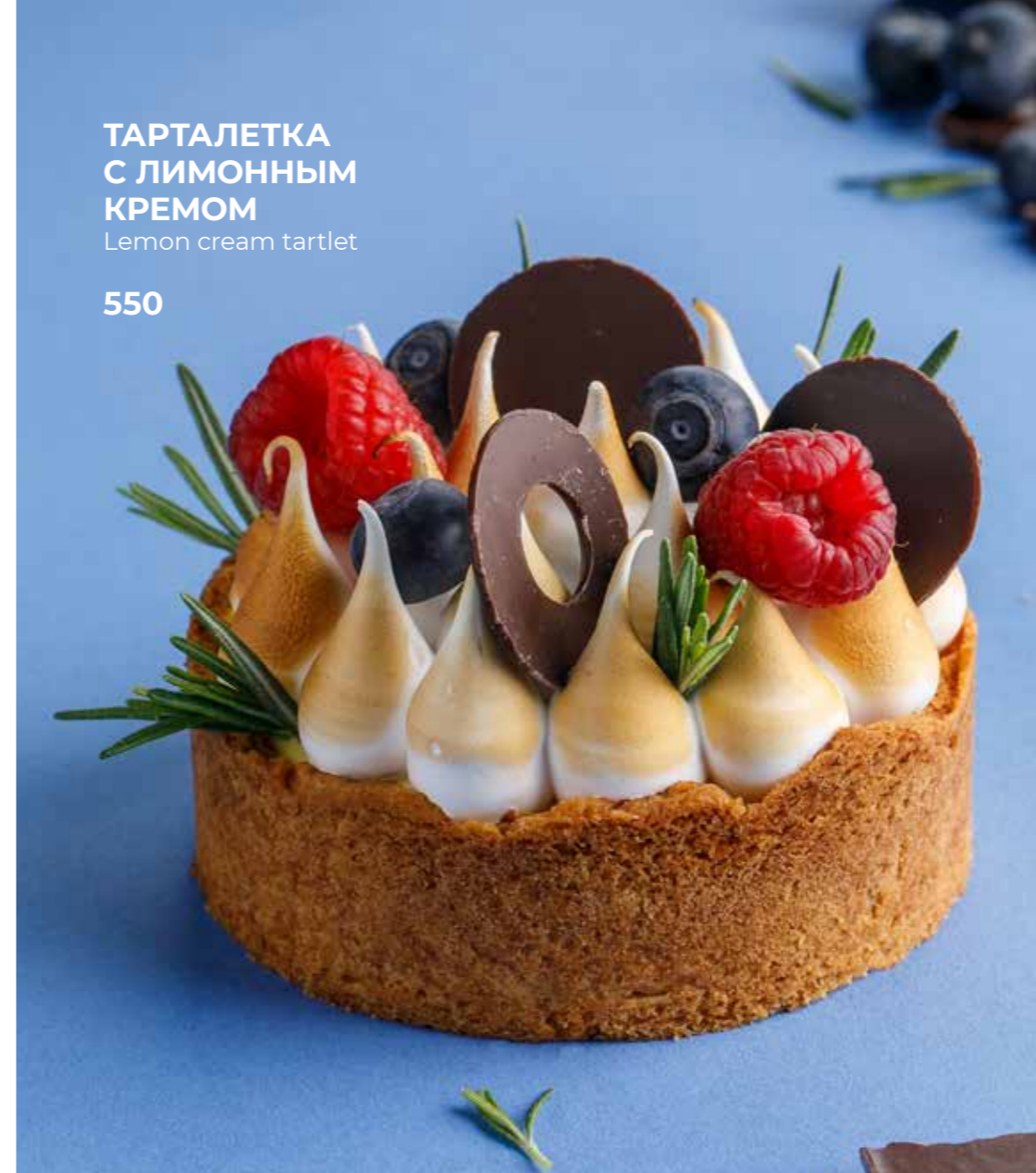
ТАРТАЛЕТКА С ЛИМОННЫМ КРЕМОМ Lemon cream tartlet