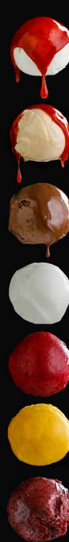
МОРОЖЕНОЕ пломбир / ванильное / шоколадное ... 190 Plombières / vanilla / chocolate ice-cream