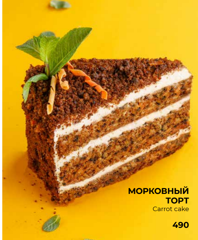
МОРКОВНЫЙ ТОРТ Carrot cake 490