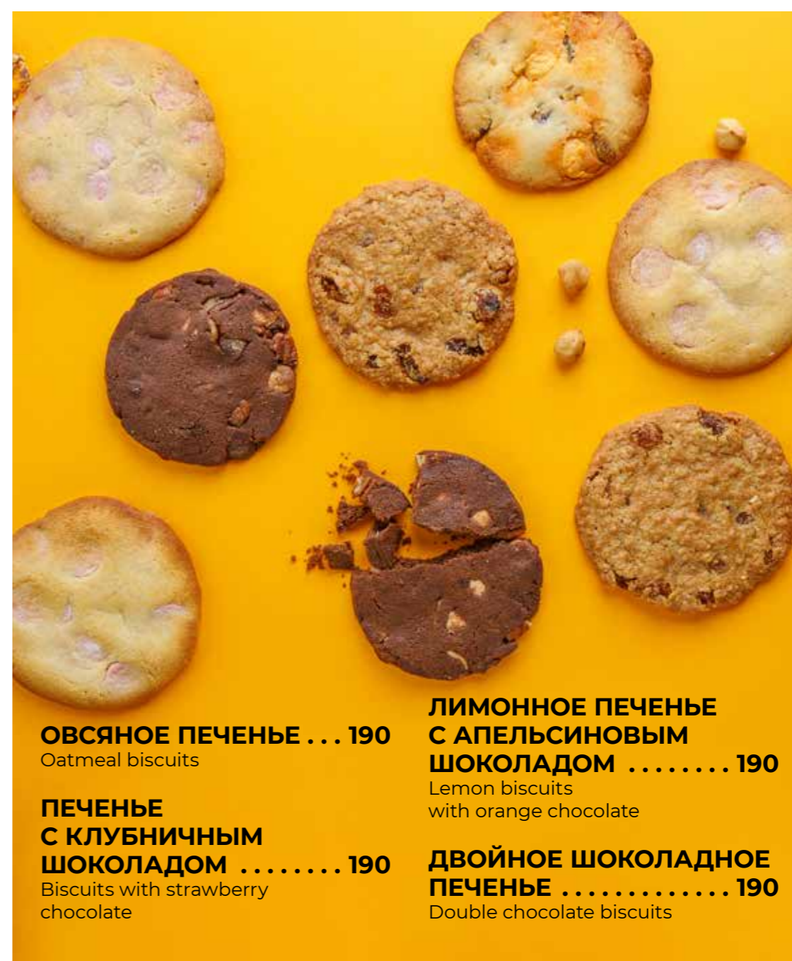
ОВСЯНОЕ ПЕЧЕНЬЕ ... 190 Oatmeal biscuits