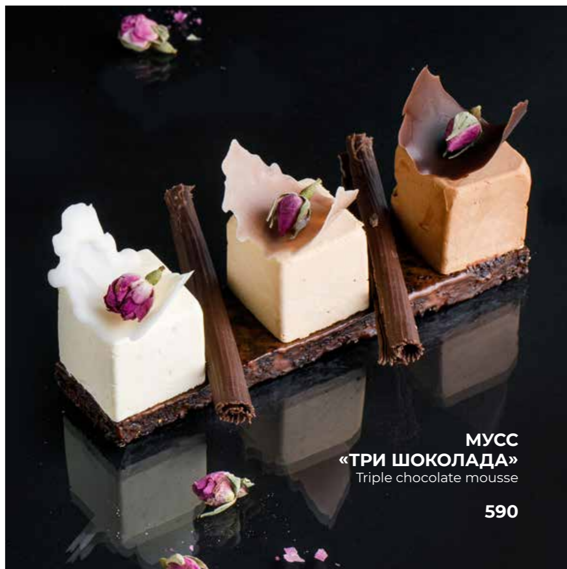
МУСС «ТРИ ШОКОЛАДА» Triple chocolate mousse