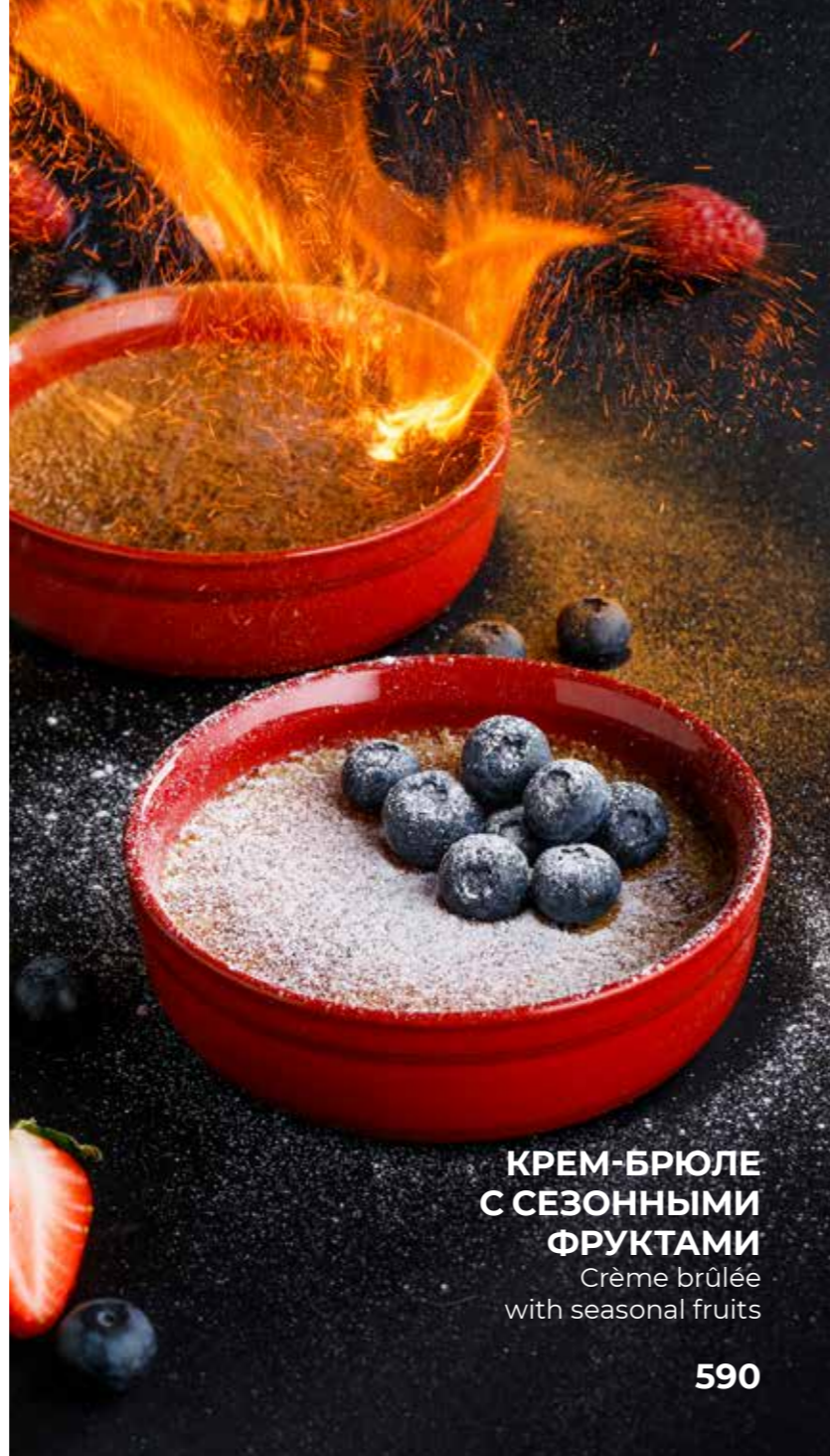
КРЕМ-БРЮЛЕ С СЕЗОННЫМИ ФРУКТАМИ Crème brûlée with seasonal fruits