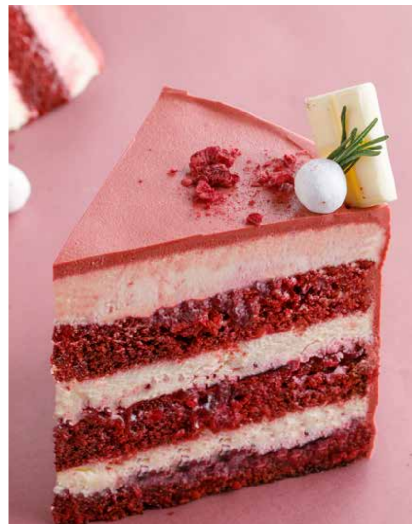
ТОРТ «КЛЮКВА» Cranberry cake