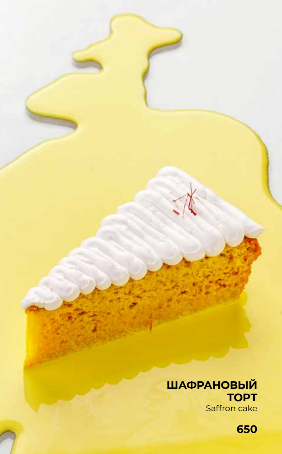
ШАФРАНОВЫЙ ТОРТ Saffron cake