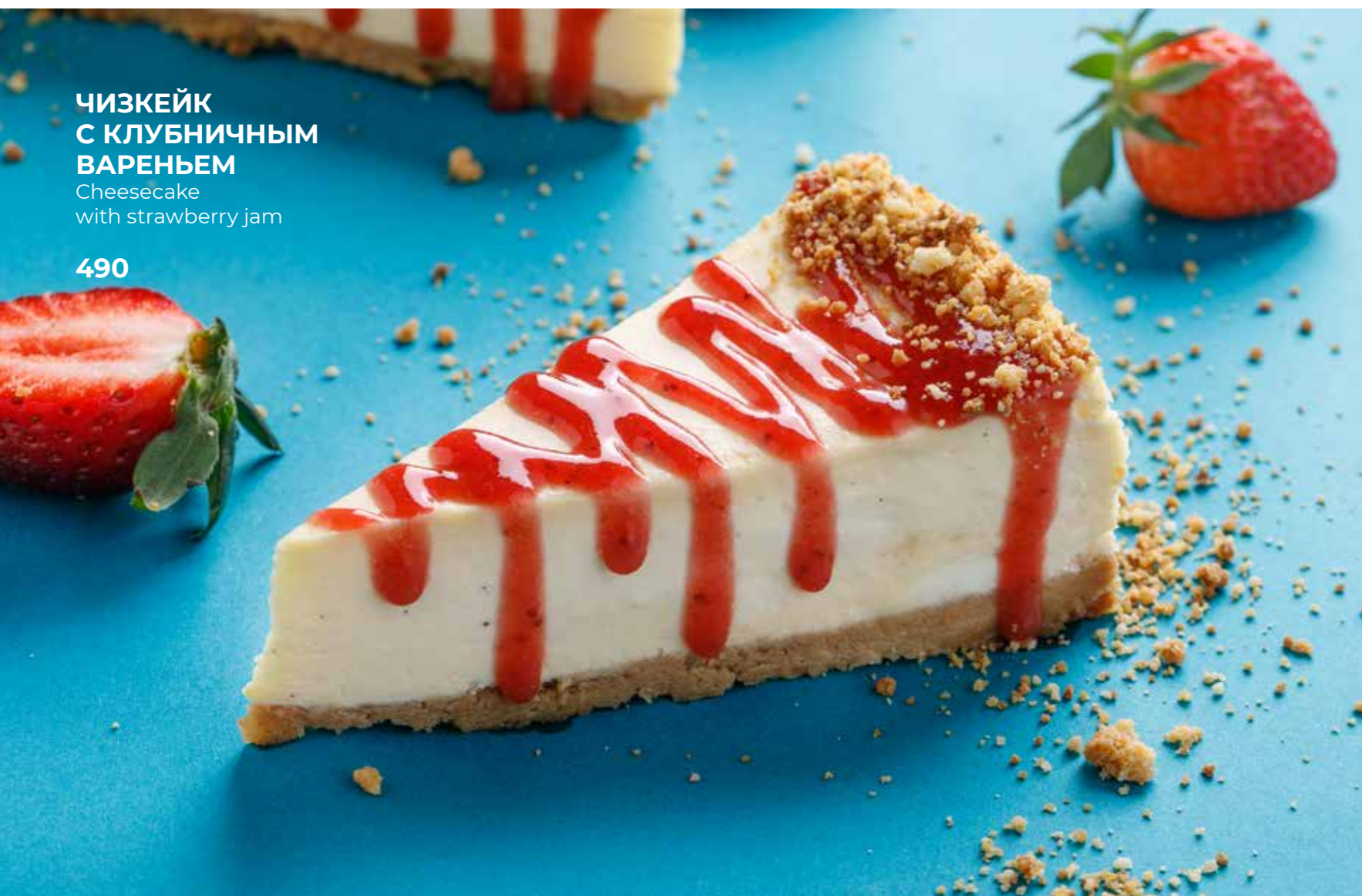
ЧИЗКЕЙК С КЛУБНИЧНЫМ ВАРЕНЬЕМ Cheesecake with strawberry jam